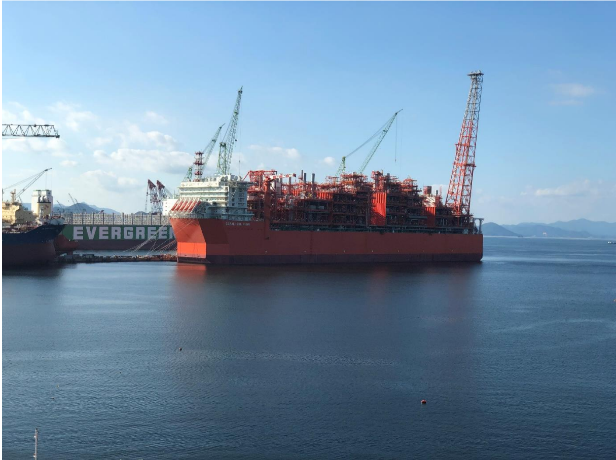
CORAL FLNG @ SHI Shipyard

Le contexte énergétique complexe, accentué par les enjeux climatiques et la pression sociétale sur la limitation des émissions de gaz à effet de serre a poussé la plupart des acteurs de l'industrie à mettre en place des stratégies pour atteindre la neutralité carbone à l'horizon 2050.